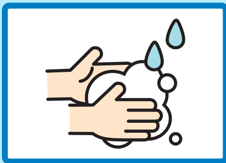
て あら 手洗い