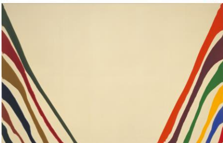
モーリス・ルイス《オミクロン》1960年 大阪中之島美術館蔵

※NAKKA：大阪中之島美術館の英語名である「NAKANOSHIMA MUSEUM OF ART, OSAKA」から、最初の3文字の「NAK」、最後の2文字「KA」を組み合わせた略称