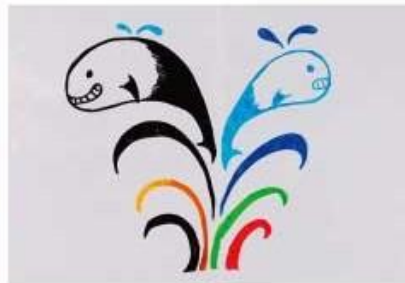
参加者による作品(イメージ)